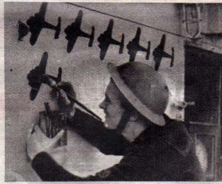
De kannonier op een Nederlandsch schip in de Britsche wateren toekent aan, hoeveel Duitse vliegtuigen hij reeds heeft neergeschoten.

Dit middelpunt is maar een bescheiden begin, dat voor uitbreiding vatbaar is zoodra daaraan behoefte