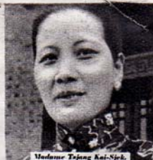
Madame Tsjang Kai-Sjek.

Aan het hoofd van een handjevol mannen vocht hij met zijn wapenbroeders tegen honderden, en soms duizenden soldaten van het keizerlijk leger. Weldra hadden zijn manschappen Shanghai en omstreken ferm in handen. Zoodra het Huis van de Mandsjoe's gevallen was, en de revolutie dus gelukt was, ging hij terug naar Japan om zijn studie