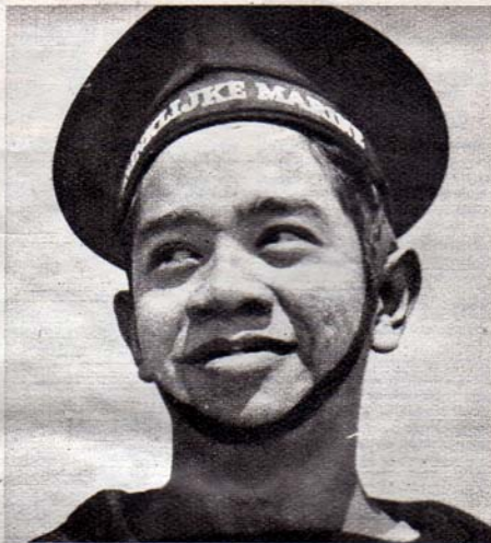
Dit is een der flinke jongens van het Nederlandsch-Indische Marine detachement, die vóór de vernietiging van Soerabaja, naar Engeland gezonden werden. Hier wordt thans hun opleiding grondig voltooid.

Gelukkig zijn daarvoor enkele voortekenen aanwezig. Dat spoedig die groote dag moge aanbreken, waarnaar Onze gedachten onophoudelijk uitgaan, die dag waarnaar Nederland nu al twee jaren reikhalzend uit ziet, de dag der bevrijding. De dag der verrijzenis van het groot denkend nieuwe Vaderland. De dag waarop Gij en Ik de golven die ons geliefd vaderland omspoelen oversteken naar ons dan vrije thuis. Met dien wensch draag ik thans dit tehuis aan U over.