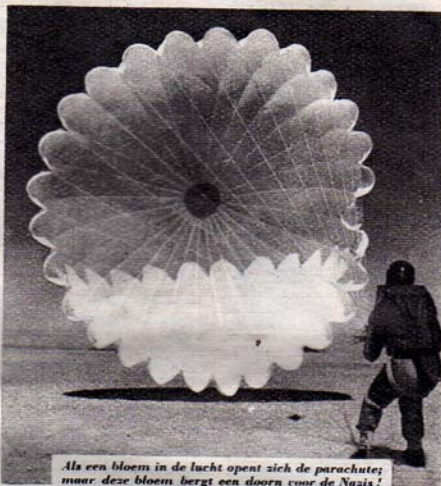
Als een bloem in de lucht opent zich de parachute; maar deze bloem bergt een doorn voor de Naxis!

Ik ben een Nederlandsche parachutist. Ja, die zijn er thans. Uit onze Koninklijk Nederlandsche Brigade Prinses Irene hebben een groot aantal vrijwilligers de gelegenheid gekregen, opgeleid te worden als parachutist. We gingen daarvoor naar een der opleidingsvelden van het Engelsche leger. Daar was een commandant die vloeiend Hollandsch spak: hij had vijftien jaar in Den Haag gewoond! En zoo velden wij ons direct thuis. Hier deden we extra gymnastiek aan trapeze en springtoren. En al den tweeden dag gingen we de lucht in om onze eerste sprong te maken. Als je zoo'n pakje parachute in je handen krijgt, voel je je eerst wel raar, maar in het vliegtuig zongen we allemaal samen. Daar gaat het roode waarschuwingslicht aan. De instructeur, die den eersten sprong maakt, gaat op den rand van het ronde licht zitten. Het groene licht knippert... het woord "Go" klinkt... en hij is al verdwenen. En dan kom ik al gauw. Ik zit op den rand... "Go," ik zet af en meteen slaat de luchtstroom mij tegen het lichaam, onbegrijpelijk hard en adembemend. En dan: rust. Het scherm is open. En een paar minuten later staan we alle twintig veilig op den grond, tusschen de witte lappen zij. En ik had nog maar een bezwaar. Dat het nog niet de Nederlandsche grond was. Maar als de dag komt, zijn de Nederlandsche parachutisten gereed."