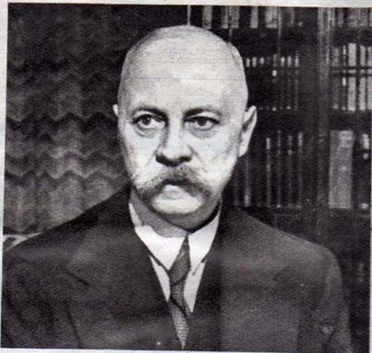
Z. E. PROFESSOR MR. P. S. GERBRANDY

P ROF. P. S. GERBRANDY is nu ongeveer drie jaar Minister, waarvan bijna twee jaar Minister-president. Hij heeft het Departement van Justitie en dat van Koloniën geleid; thans voert hij de portefeuille van het Departement voor de Algemene Oorlogvoering van het Koninkrijk. Maar ver-uit het zwaarst is de last dien hij