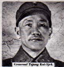
General Tsjang Kai-Sjek.

Ieder van ons, tot welke klasse hij in het verleden behoort moge hebben, kan heel wat bijdragen, zoowel tot het heden als tot de toekomst, door zich een kameradschappelijke houding eigen te maken, vrij van alle gevoelens van vrees, wrok of afgunst, en de levenshouding van sympathie en vriendschap te aanvaarden, die in het verleden steeds de diepste uren van onze beproefing gekenmerkt heeft. Laat ons menschelijk gevoel en niet onze stoffelijke belangen ons leven beheerschen.